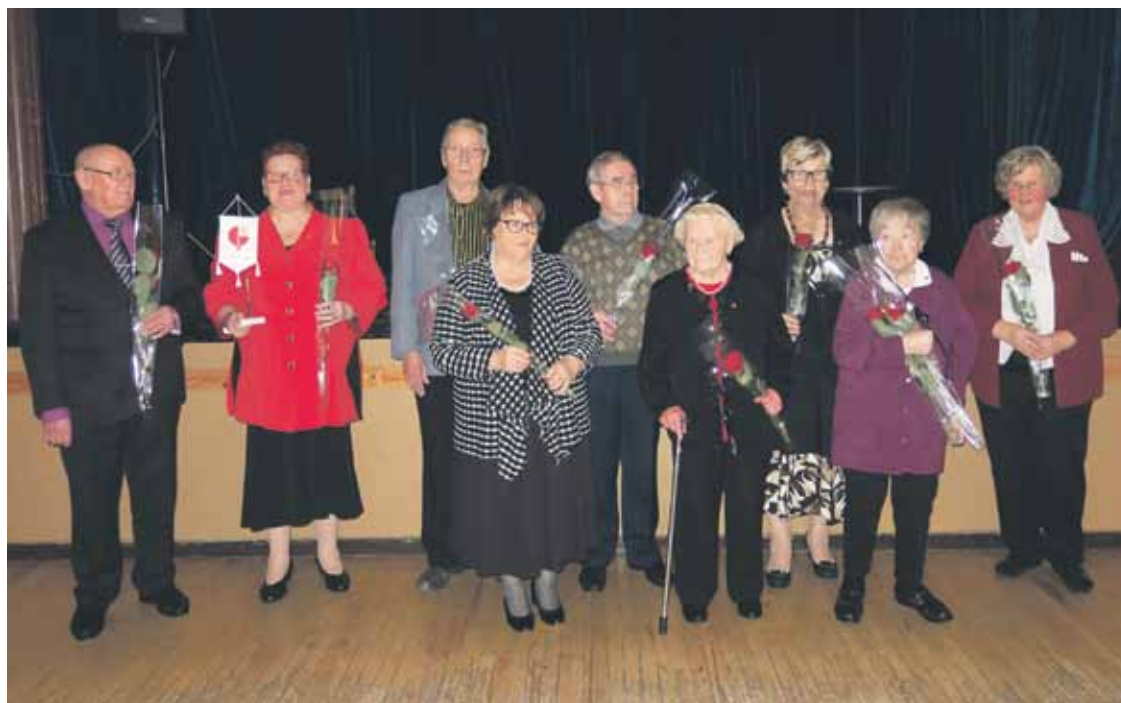
Tampereen yhdistyksen ansioituneita jäseniä.