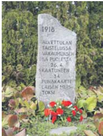
Muistokivi punaisten joukko-haudalla Alvetulassa.

Retkeen liittyen on mahdollista yöpyä Vähäjärven lomakodissa, ja järjestämme iltaohjelmaa jos kiinnostusta ilmenee.