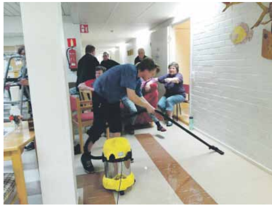
Innokas ja ahkera talkooporukka laittoi talkoissa lomakotimme uuteen uskoon. Lämmin kiitos koko joukolle, apunne on korvaamattoman arvokasta.