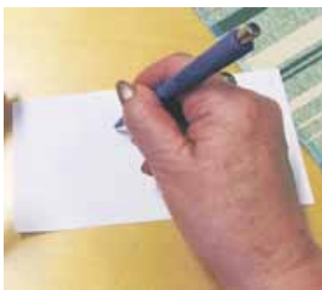
Tästä se alkaa. Ajatusten kirjaaminen tyhjälle paperille.

Jäsenistössämme on monia tällaisia henkilöitä. Eivät käy kerhoissa, mutta haluavat olla kuitenkin mukana edistämässä hyviä arvoja. Kiitos siitä. Meitä kaikkia tarvitaan. Toki toivoisimme näkevämme jäsenet "livenä" tilaisuuksissamme. Ja uudet jäsenet, tervetuloa.