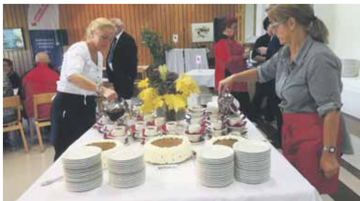
Vähäjärven herkut maistuivat.

eellisen väestön tasolle (sanoetaan sitä sitten kuntayhtymäksi tai maakunnaksi) ja Helsinki jo yksinään muodostaa 450 000 väestöllä riittävän laajan väestöpohjan palveluiden turvaamiseksi, selitti Kekomäki.