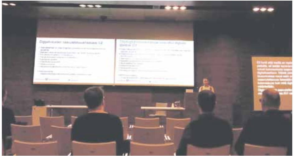
Ylitarkastaja Vieno Rainio valisti kuulijoita digipalveluiden saavutettavuudesta.

Voit antaa palautetta saavutettavuudesta sen jälkeen, kun lain saavutettavuusvaatimukset alkavat koskea palvelua. Useimpien verkkosivustojen pitää olla lain vaatimusten mukaisia 23.9.2020. Palautetta voit antaa niistä sivustoista, joita lain vaatimukset koskevat. Käytännössä lähes kaikki julkisten toimijoiden verkkopalvelut ovat lain piirissä – esimerkiksi Kelan, verottajan, TE-toimistojen sekä kaupunkien ja kuntien verkkosivustot ja verkkoasiointi.