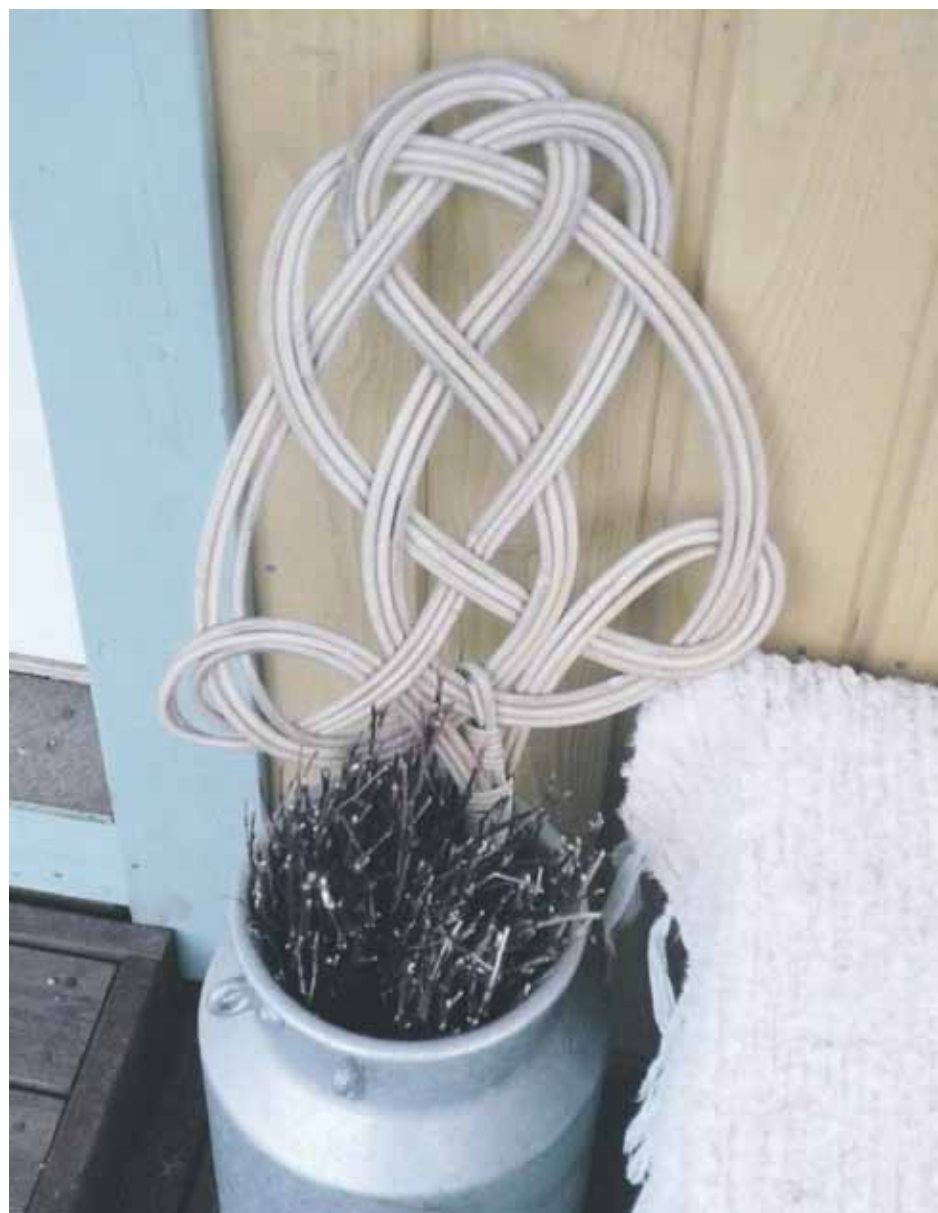
Kotitalousvähennyksestä voidaan myöntää kotitaloustyöstä, jota teetetään kotona tai vapaa-ajan asunnossa.