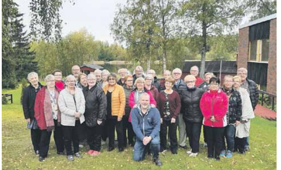
Oulun Ikmon osallistajat alkusyksyn maisemissa Vähäjärvellä.