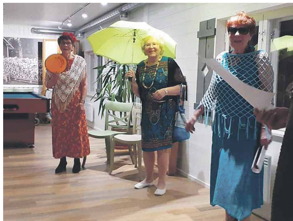
Muotinäytös ilahdutti IKMO-kurssilaisia.