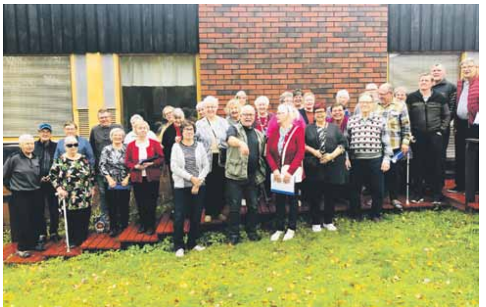
Rauman ja Lappeenrannan Ikmon osallistajat. Osallistujia oli myös muista alueen järjestöistä mm. Epilepsia yhdistyksestä, Rauman Hengitysyhdistyksestä ja Satakunnan aivovammayhdistyksestä.