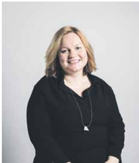
Krista Kiuru.

Hallitusohjelmassa on linjattu, että kuntoutusjärjestelmää uudistetaan kuntoutuksen uudistamiskomitean ehdotusten pohjalta. Tarkoitus ei ole tehdä yhtä isoa kuntoutuksen uudistamishanketta, vaan kuntoutuksen uudistamista toteutetaan esimerkiksi osana työkykyohjelmaa, mielenterveysstrate-