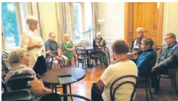
Vammaisten lähetystö Porin kaupungin luottamushenkilöjohdon juttusilla.