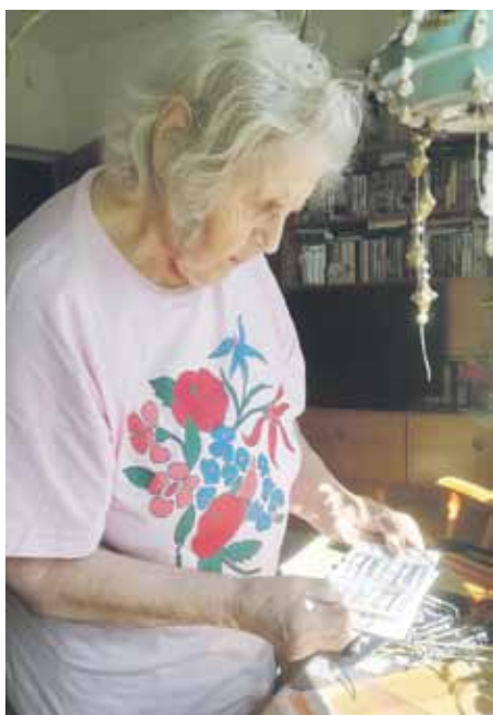
Jäsenkirja sen todistaa: 30 vuotta Porin sairaus- ja tapaturmainvalidien jäsenyyttä.

koneiden ehdoilla ollut helppoa sekään. Rengaskehräjän ammatti oli yhtä juoksemista ja jalkojen päällä olemista. Työnä oli lankojen kehruu kahdeksalla koneella eli vahtia kaikkia koneita työvuoronsa aikana.