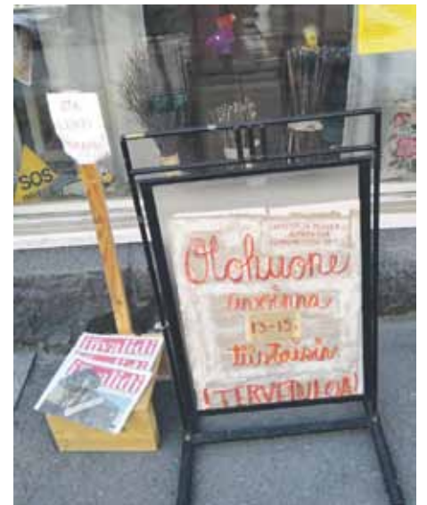
Tiistaisin HeSSTIn Olohuone on kaikille auki.

Tiistaisin klo 13 - 15 on HeSSTIn toimistolla Kulmavuorenkadulla avoimet ovet ja kahvia tarjolla eli Olohuone on auki jäsenten tapaamista ja vapaata seurustelua varten. Olohuoneessa on askarreltu, tehty käsitöitä, pelattu korttia, kuunneltu runoja. Osallistujat voivat itse keksiä ohjelmaa. Käsitöitä on lahjoitettu Vä-