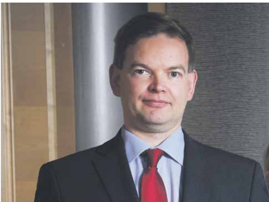
Eduskunnan apulaisoikeusasiamiehen sijainen Mikko Sarja.