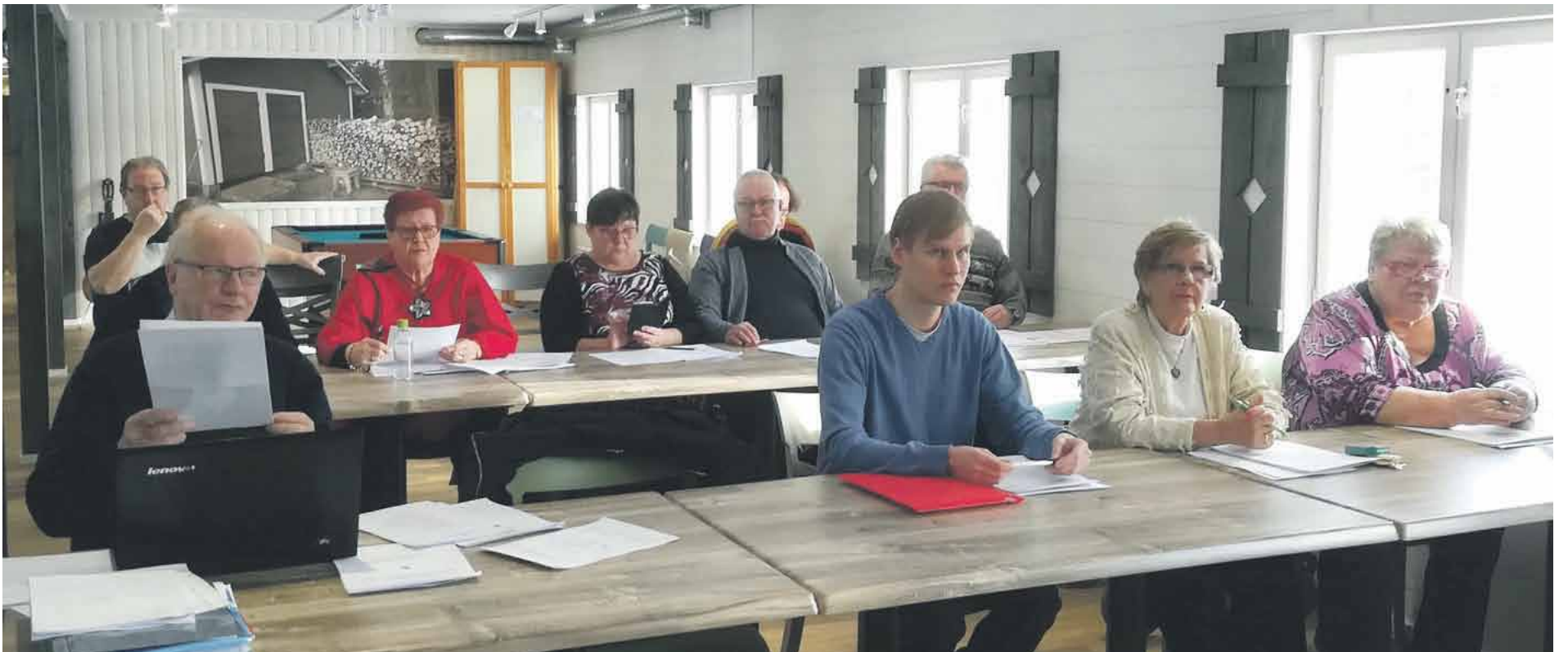
Liittovaltuustoa huoletti yhteistyöilmapiirin säilyminen.