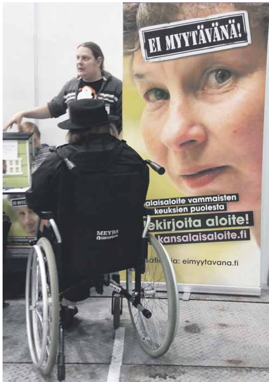
Ei myytävänä-kansalaisaloitteeseen kerättiin 72 000 allekirjoitusta.

Nyt on vaadittava kokonaan toisenlaista vammais- ja vanhustenhoiton politiikkaa uudelta eduskunnalta ja pikaisesti. Sitä ei auta yksityistämisen eikä asioiden hauduttaminen