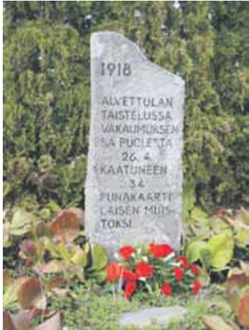
Muistokivi punaisten joukko-haudalla Alvetulassa.

Retkeen liittyen on mahdollista yöpyä Vähäjärven lomakodissa, ja järjestämme iltaohjelmaa jos kiinnostusta ilmenee.