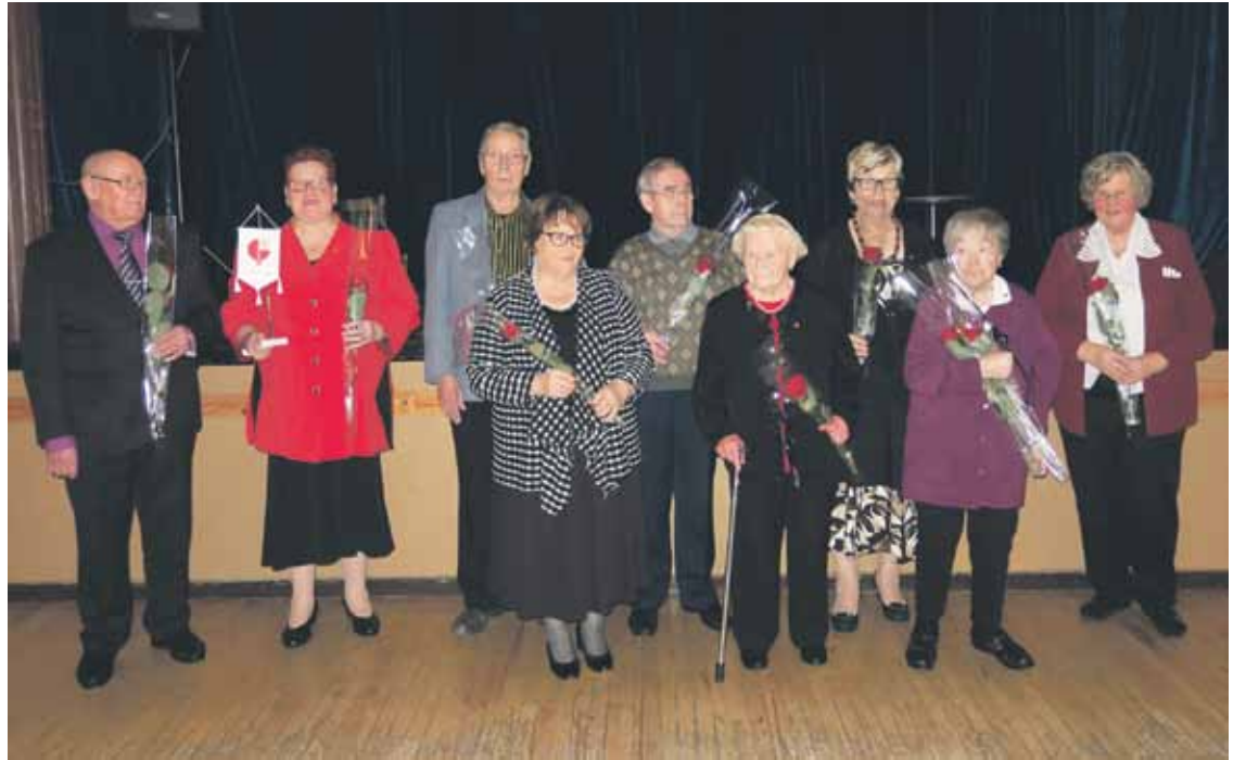
Tampereen yhdistyksen ansioituneita jäseniä.