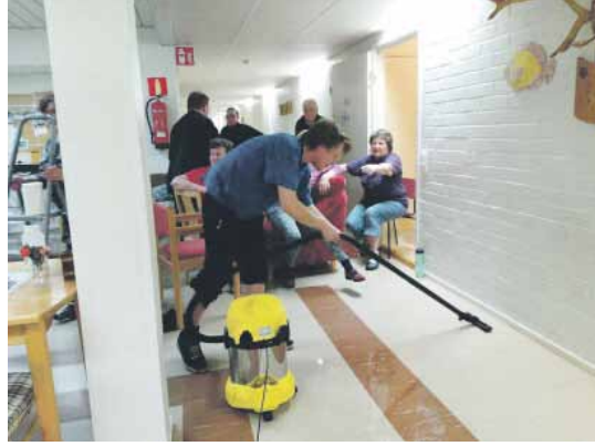
Innokas ja ahkera talkooporukka laittoi talkoissa lomakotimme uuteen uskoon. Lämmin kiitos koko joukolle, apunne on korvaamattoman arvokasta.