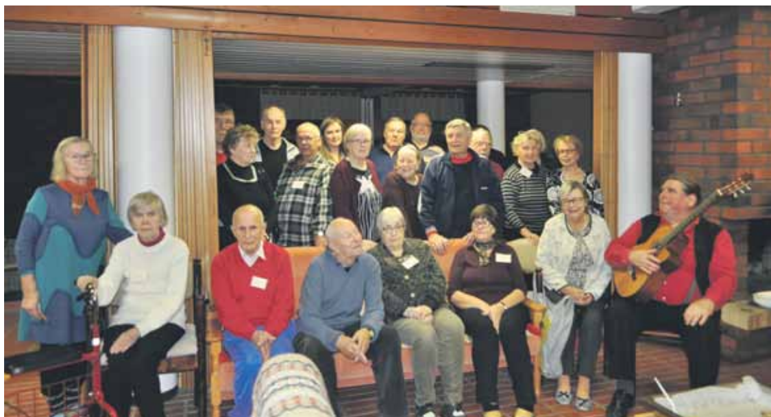
Kuntokurssilaiset illanvietossa.