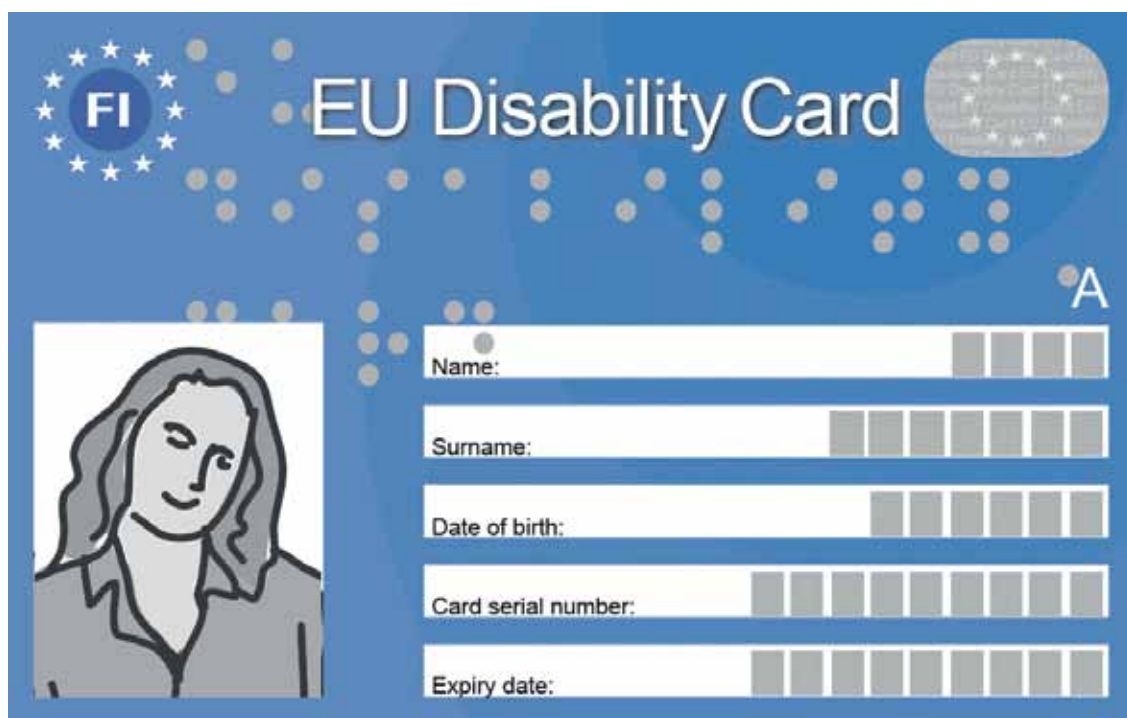
Mallikuva EU:n Vammaiskortista